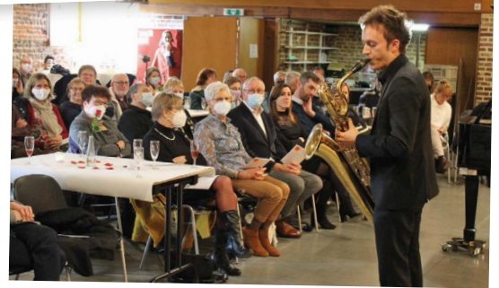
ACADEMIE MWD GOOIK