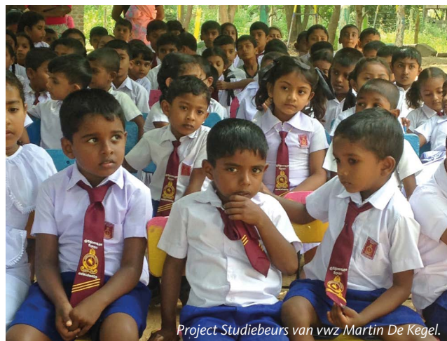
Project Studiebeurs van vzw Martin De Kegel.