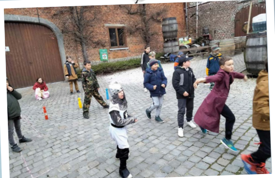
SPEELPLEIN 'T FOENJSJSKE GOOIK

Kunstenaar Jan Springael creëerde 'Pad(en)Broek'. Het was meteen duidelijk dat dit beeld een definitief plekje moest krijgen in Paddenbroek. Het beeld werd deels aangekocht door de Cultuurraad, aangevuld met middelen van de gemeente Gooik. Zij schonken het beeld aan Plattelandscentrum Paddenbroek. Kom zeker even kijken naar het prachtige beeldje!